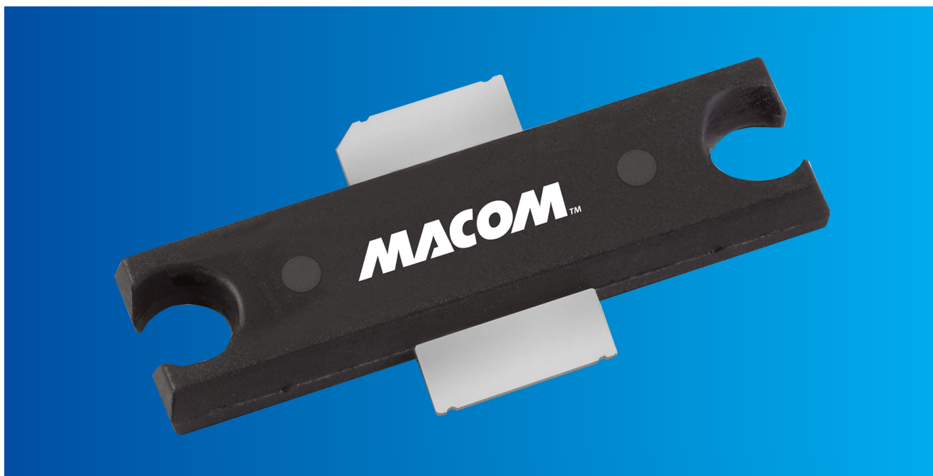
Рис. 1. Четвертое поколение нитрид-галиевых транзисторов макет для коммерческого применения

В статье рассматриваются преимущества использования технологий на основе нитрида галлия при создании СВЧ-приборов — от изделий радиоэлектроники до бытовой техники.