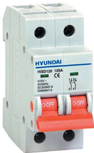
● Рис. 2. Модульный двухполюсный выключатель нагрузки

Дифференциальные автоматические выключатели защищают цепи от токов перегрузки, короткого замыкания и утечек на землю, то есть являют собой автоматический выключатель и УЗО в едином корпусе. Таким образом, они