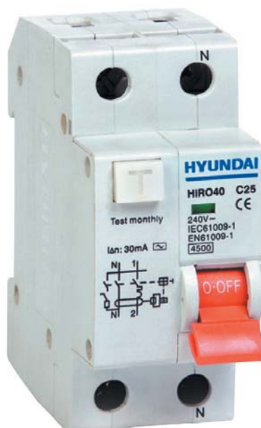
● Рис. 3. Двухполюсный дифференциальный автоматический выключатель серии HiRO