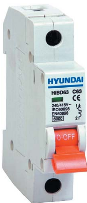
● Рис. 1. Модульный автоматический выключатель серии HiBD63

При выборе выключателя следует обращать внимание на количество защищенных расцепителями полюсов: 2- и 4-полюсные выключатели могут быть как в конфигурации 2P, 4P, так и в конфигурации 1+N, 3+N соответственно. В серии HiBD63 доступен нестандартный ряд номинальных токов 1, 2, 3, 4, 5, 6, 10, 13, 15, 16, 20, 25, 32, 40, 50, 63 А с характеристиками отключения типов В, С, D, что позволяет соот-