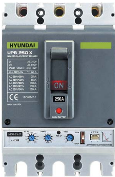
● Рис. 6. Трехполюсный автоматический выключатель в литом корпусе серии U с полупроводниковым расцепителем

Моторные приводы для дистанционного управления выключателями подходят к обеим сериям — H и U — и рассчитаны на напряжения 24, 110 или 220 В постоянного или переменного тока.