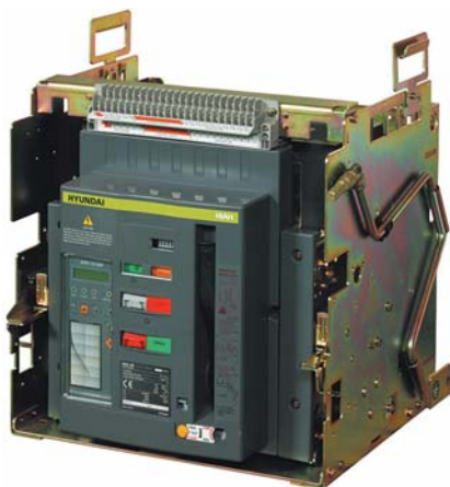
● Рис. 7. Воздушный автоматический выключатель выкатного исполнения

Данные устройства (рис. 7) рассчитаны на диапазон токов от 630 до 6300 А и содержат в себе передовые достижения коммутационных технологий Hyundai. Об этом говорят следующие показатели: высокая отключающая способность и высокая динамическая стойкость при напряжении 500 В AC — от 70 до 130 кА.