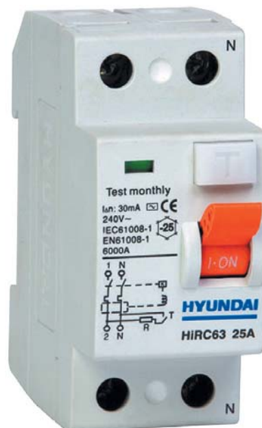
● Рис. 4. Двухполюсный дифференциальный выключатель нагрузки (УЗО) серии HiRC