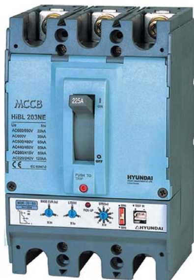
● Рис. 5. Трехполюсный автоматический выключатель в литом корпусе серии Hi с полупроводниковым расцепителем

Автоматические выключатели данной серии имеют самую высокую в мире отключающую способность 200 кА при 240 В AC (Q-class в серии U для применения на атомных энергетических объектах) в компактном корпусе размерами 105×146×86,5 мм.