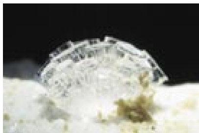
● Рис. 3. Группа монокристаллов томсонита, относящегося к цеолитам семейства натролита

– Ситуация с «четвертой волной» напоминает историю со строи-