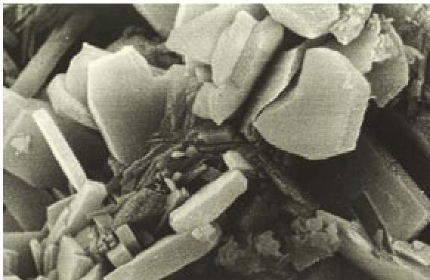
● Рис. 2. Электронная микрофотография кристаллов клиноптилолита (крупные пластины) в смеси с тонкими вкраплениями сопутствующих минералов

вился в Москву за американской визой, но – сюрприз! – посольство США ему отказало на том основании, что данная область знаний (нанотехнологии) находится под жестким контролем Госдепартамента. Оказалось, что для участия в подобной конференции надо было подавать заявку за месяц! В других случаях – на конференции по проблемам элементарных частиц, по ракетным делам и т. д. – визы выдавались в течение одного-двух дней.